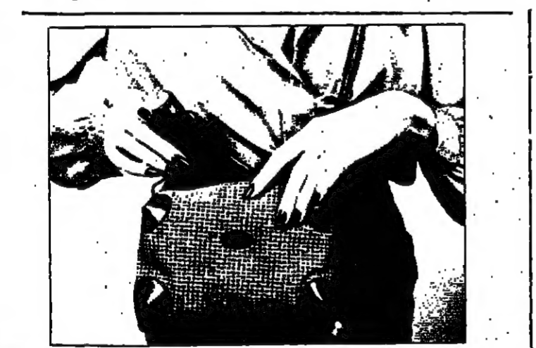
تميز هذا الحنجر، انه يمكن تديله بعد فراقه بسر زديد جدا، فلا عن انه صار على الموضة.